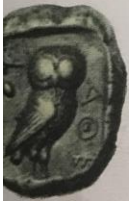
y drachmy. Ra- ata. Na obráz- (čtyřdrachma runu). Protože ě Pallas Athé- rét a také její nské drachmy é egejské ob- v moderním lo společnou