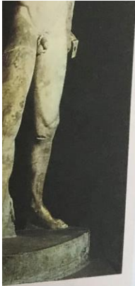
tyranidy tak vý- ří tyrany vyhnali, isoší. Jmenuje se